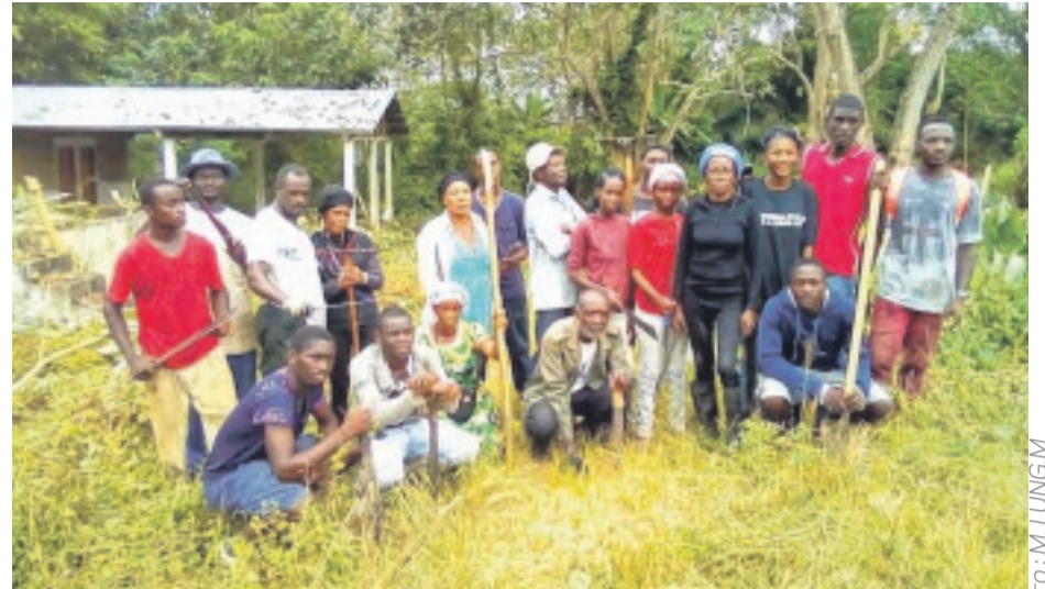
Les membres de TGV lors d'une opération de désherbage à Tchibanga.